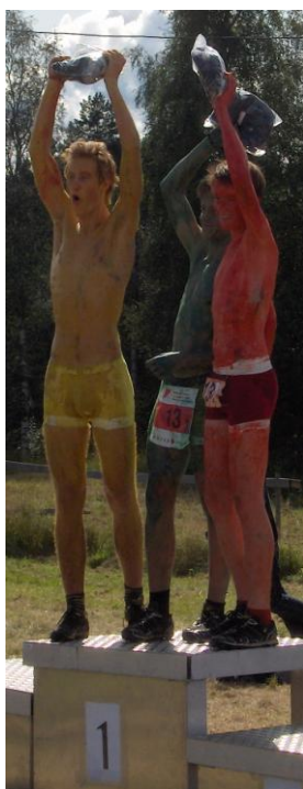
O-Landsleir, kostymepris